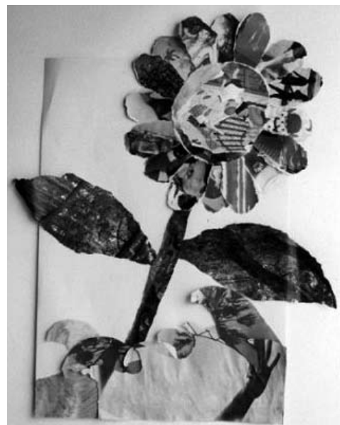
図2 Aコラージュ No.5

コラージュ開始から2か月経過の作品No.5(図2)では、使いたい色彩のチラシをちぎったり、はさみを入れ、地面に咲く1輪の花を完成させる。