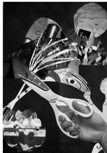
図5 Bコラージュ No.21

その後、新聞類で台紙を埋め尽くした上に文字やトリミングされた人物や動物・物を貼ることを繰り返していく過程で、しだいに台紙に貼られない空間が生まれてくる。この間、Bの作品には、文字キャプションの切抜きも必ず入るといった特徴があった。コラージュ開始から4か月後のNo.21（図5）になると、「リアリティ、立体感を出したかった」と、“紙にはさみを入れる”切抜きをトリミングして貼る。背景には、B