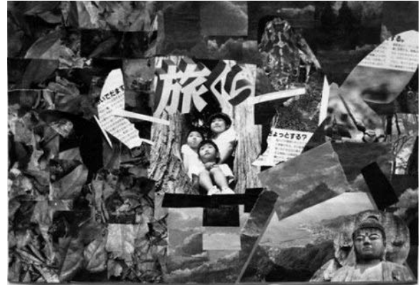
図4 Bコラージュ No.11

バ（正位置、中央下）などであり、左側の空間に集中している。右側は、民族的な写真や文字のある程度の大きさ・色に分けて切り貼りしており、この色彩表現は、モンドリアン（Pieter Cornelis Mondriaan 1872-1944）の究極・抽象表現を髣髴させる。