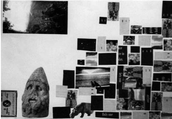
図3 Aコラージュ No.18