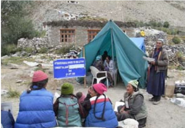
写真1-3 ドムカルにて、LIPのスタッフがテントの中で採血を行う。

採血は、Ladakh Institute of Prevention (以下、LIP) に所属する医療スタッフによって行われた(写真1-3)。LIPからは、医師1名、看護師・検査技師5名が参加し、加えて、通訳や健診補助スタッフ、キャンプの炊き出しをする料理人など、総勢20名をこえるスタッフによって医学健診は運営された。