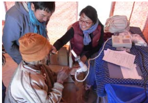
写真1-2 ドムカル谷(3000~3800m)でのメディカルキャンプ。呼吸機能検査の様子。