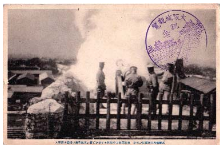
写真1. 大阪城における午砲発射の絵葉書(筆者コレクションより) 4名の陸軍午砲担当者の中央に午砲用の大砲が見える

明治19(1886)年7月12日の勅令第51号の定めにより明治21年1月1日から東経135度の子午線の時刻が日本の標準時となったことを広く知らせるために、東京、大阪など日本各地に設置された午砲用の号砲台で実施されたものだ。