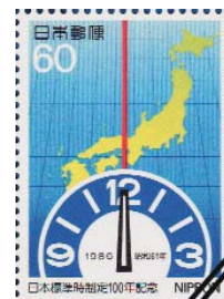
写真3-2. 日本標準時制定100年記念切手 日本地図上に東経135度の子午線と明石天文科学館の時計がデザインされている。

正午5分過ぎの時刻は午前12時5分なのか午後12時5分なのか話題になることがある。誤解を避けるためには正午5分過ぎは午後0時5分と称すればよいのだろうか、正午過ぎの1時間を「12時何分」と呼びたくなるのは時計の文字盤の一番上に「12」あるいは「Ⅻ」の文字があるためだろうか? 余談だが、筆者は、1993年、ラオスの首都ビエンチャンの市場で文字盤最上部に「0」と記された機械式の腕時計を見つけた。この時計、白い文字盤の中央にロシア文字でペレストロイカと書かれていたので、かつてのソ連製であろう。珍しかったので購入したのだが、使われないまま、引き出しの奥で静かに眠っている。