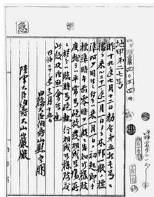
写真2. 内務大臣が陸軍大臣にあてた号砲発射依頼の文書

この臨時号砲執行についての文書(内務大臣山縣有朋が陸軍大臣大山巖に対して標準時初起臨時号砲執行を照会した明治20年12月15日付けの内務省文書、陸軍省がその旨了解することを決定した同年12月17日決裁の陸軍省文書、そして、各地の号砲台へ臨時号砲執行の指示を決定した同22日決裁の陸軍省文書)は、国立公文書館アジア歴史資料センターで閲覧することができる。