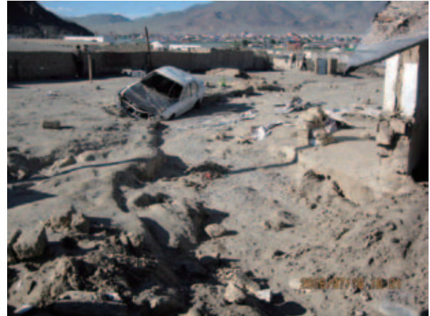
写真5 2016年7月モンゴル最西部ウルギーでの洪水。近年はゾドだけでなく、洪水などの災害も多発している。