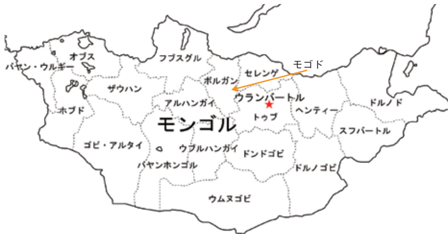
図1 モンゴル地図とモゴドの位置