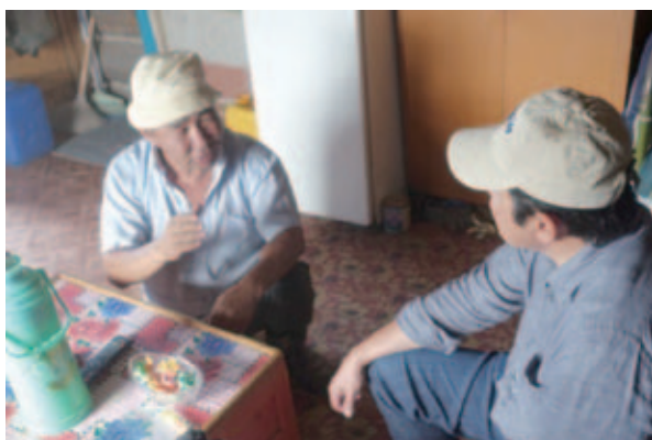
写真 10 ソム中心の定住区で、子どもの時の地震の体験をかたる PB 氏