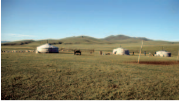
写真1 数家族が共同して暮らすホト・アイル