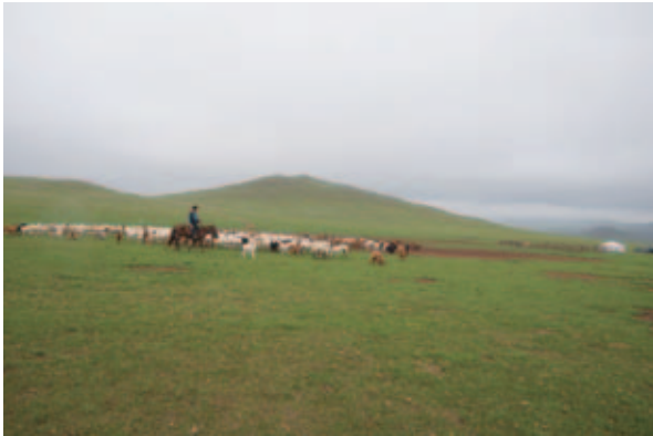
写真2 ヒツジとヤギの群をゲルの方に追う遊牧民