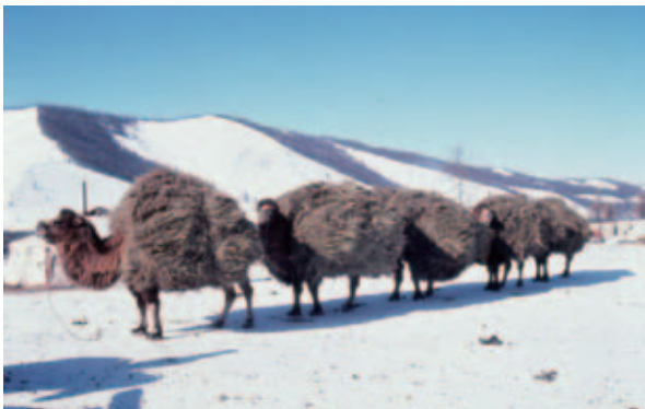
写真3 雪害に備え干草を運ぶラクダ：モンゴル北部フブスグル県