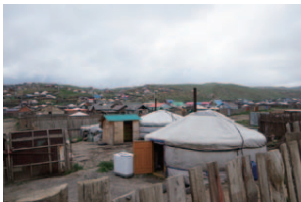
写真 13 ウランバートル市周辺部のゲル地区