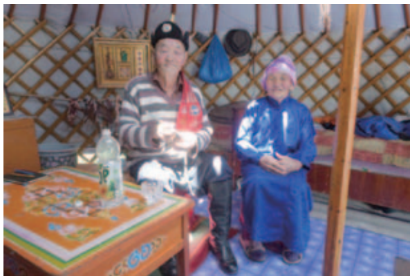
写真 8 草原のゲルの中で地震の記憶を語るご夫妻