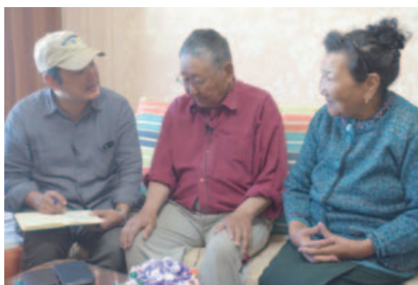
写真 12 ボルガン市のアパートで、地震の記憶を語るご夫妻