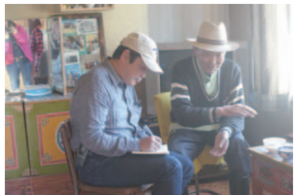
写真7 地震当時のモゴド・ソムについて語る元副ソム長