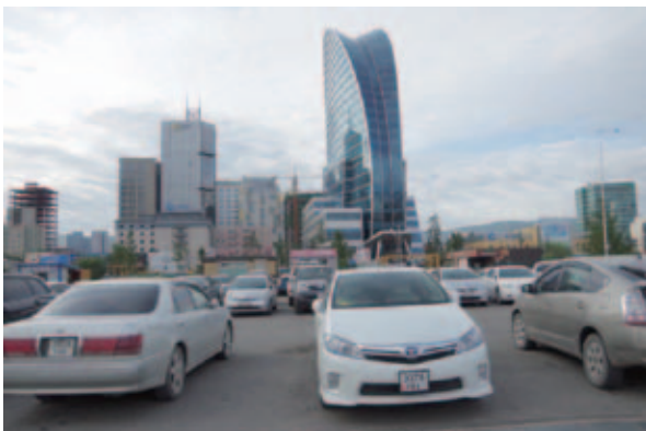
写真4 高層ビルが次々と建設されているウランバートル市中心部