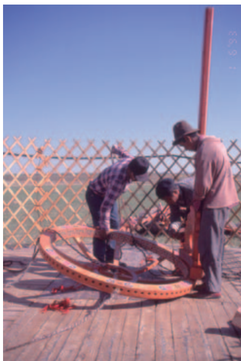
写真 9 ゲルの組み立て。厳しい自然環境のなかで考えだされたゲルは移動性・居住性に優れ、災害に強い、極めてレジリエントな家屋である。