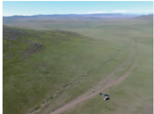
写真6 UAVから撮影した地表地震断層